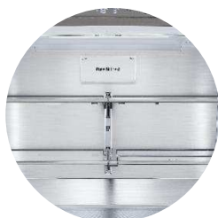
Filtere anti-odeur Pure N Fresh