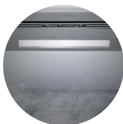
Éclairage Soft LED