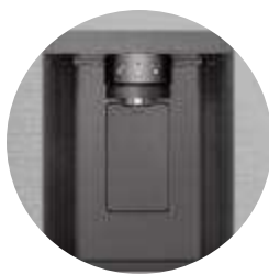
Distributeur d'eau épuré