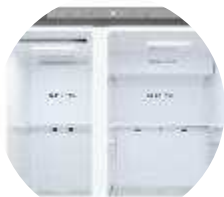
Affichage intérieur discret