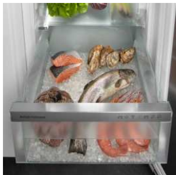
Fish & Seafood-Safe

L'aperçu présente un extrait des principales caractéristiques de l'appareil. Vous trouverez toutes les autres caractéristiques de l'appareil ainsi que des informations complémentaires sur home.liebherr.com .