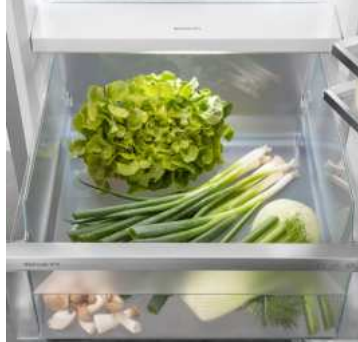
Compartiment Fruit & Vegetable

Vous souhaitez disposer d'un refroidissement professionnel de vos fruits et légumes ? HydroBreeze saura vous inspirer : la brume fraîche, combinée à la température du compartiment à peine supérieure à 0 °C, donne aux aliments le coup de pouce supplémentaire pour une plus longue durée de conservation. L'effet visuel est également impressionnant. HydroBreeze est automatiquement activé pendant 4 secondes toutes les 90 minutes et pendant 8 secondes lorsque la porte est