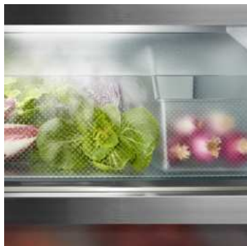
BioFresh avec HydroBreeze

Vous souhaitez disposer d'un refroidissement professionnel de vos fruits et légumes ? HydroBreeze saura vous inspirer : la brume fraîche, combinée à la température du compartiment à peine supérieure à 0 °C, donne aux aliments le coup de pouce supplémentaire pour une plus longue durée de conservation. L'effet visuel est également impressionnant. HydroBreeze est automatiquement activé pendant 4 secondes toutes les 90 minutes et pendant 8 secondes lorsque la porte est